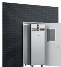
Hauteur réduite pour faciliter le passage des portes